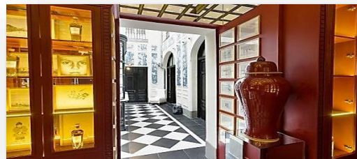
Ejemplo Tiras con cambio de color ( Hotel )