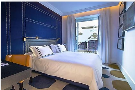
Ejemplo Tiras Iluminacion indirecta BC/BF( Hotel )