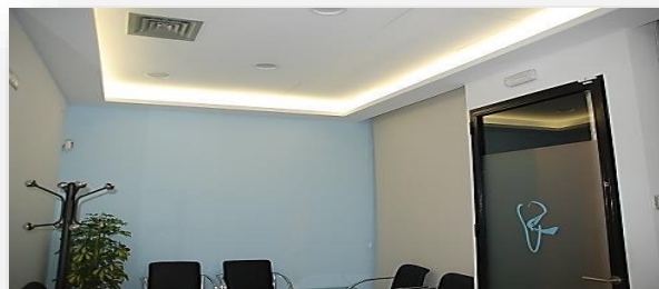
Ejemplo Tiras en luz indirecta