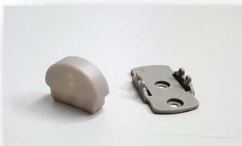
Fijación y Tapa